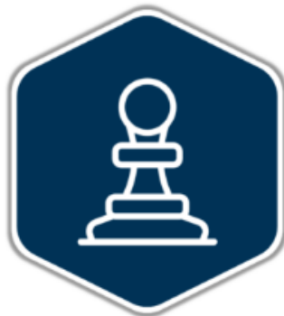
BORDSPEL ONLINE VEILIGHEID